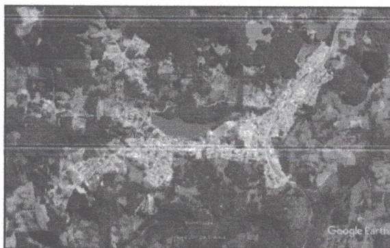
Figura 2 - IMAGEM AÉREA CORRESPONDENTE AO MUNICÍPIO DE IRANI