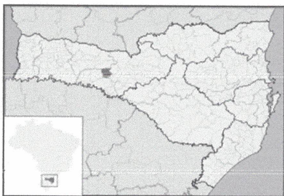
Figura 1 - LOCALIZAÇÃO DO MUNICÍPIO DE IRANI NO ESTADO DE SANTA CATARINA

Ressaltamos principalmente a atuação de nossa Guarnição, em localidades no interior do município, considerando suas dimensões de estradas com ausência de pavimentação, exigindo uma manutenção preventiva e corretiva constante das viaturas.