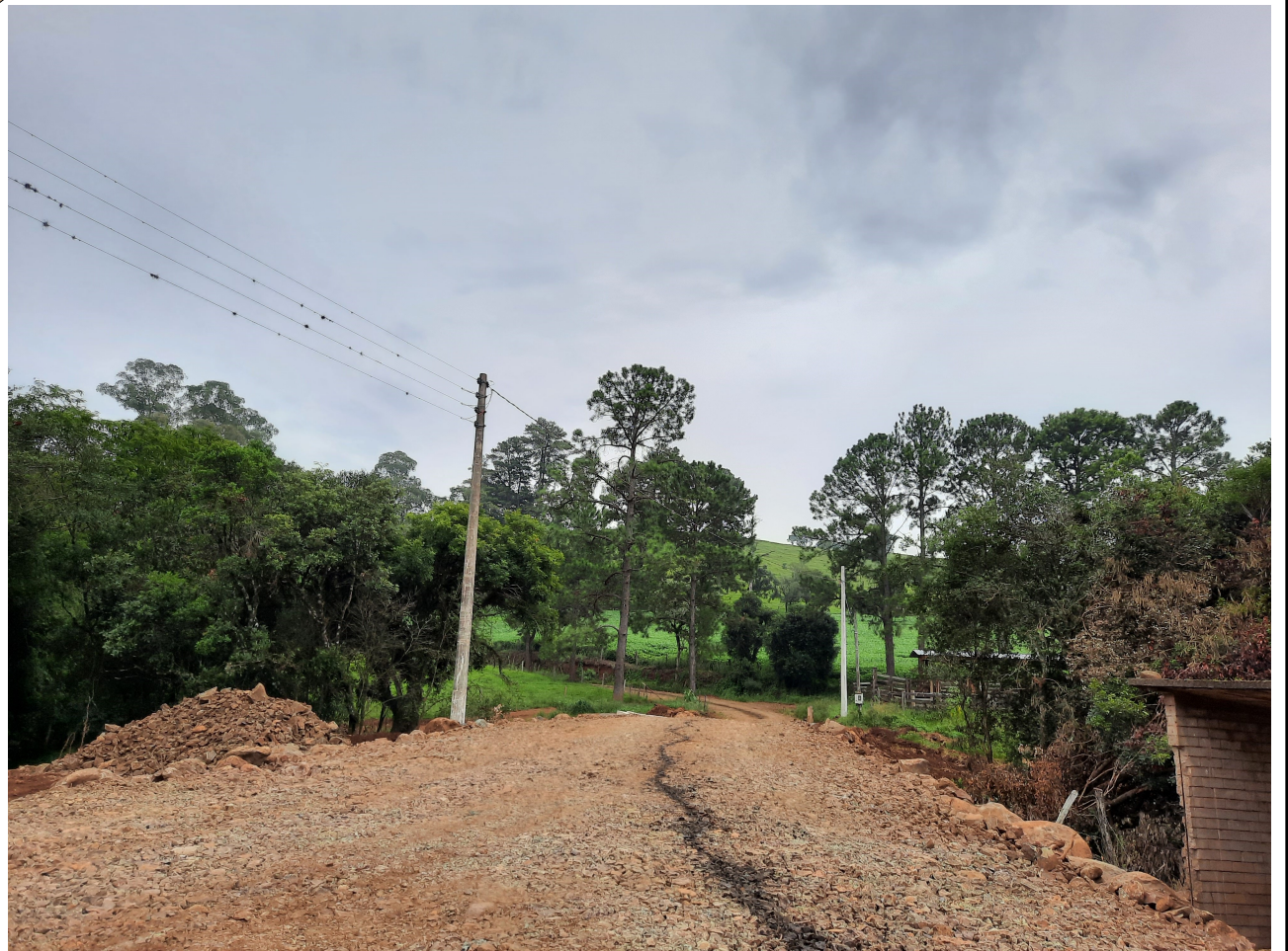
Figura 1 - Postes entre a ponte.