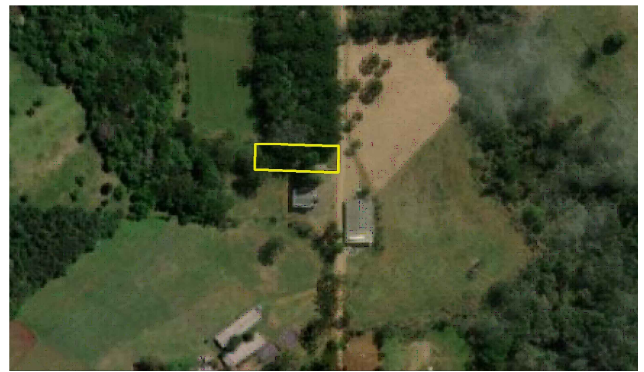
PLANTA DE SITUAÇÃO Esc: 1/2000