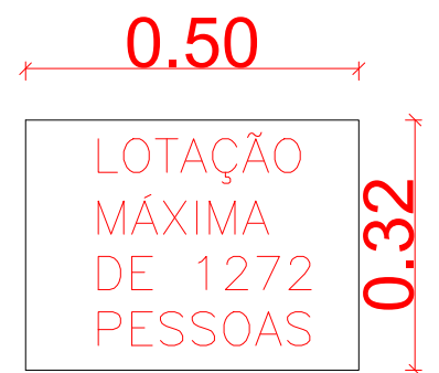
PLACA DE LOTAÇÃO MÁXIMA DE PESSOAS-QUADRA DO GINÁSIO ESCALA 1:20