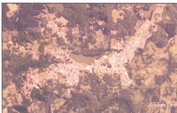
Figura 2 - IMAGEM AÉREA CORRESPONDENTE AO MUNICÍPIO DE IRANI