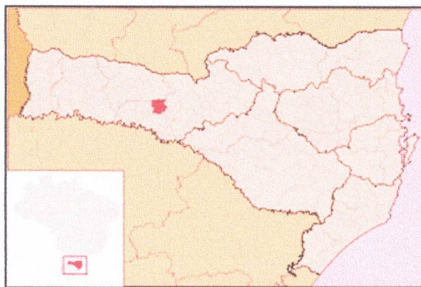
Figura 1 - LOCALIZAÇÃO DO MUNICÍPIO DE IRANI NO ESTADO DE SANTA CATARINA