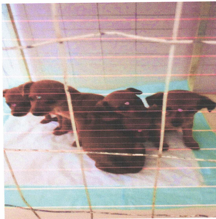
Foto dos 5 animais.