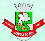
Lindóia do Sul