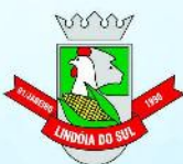
Lindóia do Sul